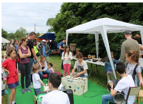
Le Stand musical à la Broc'n Roll

Notre stand s'installe pour réunir les gens autour d'une découverte originale de la musique, durant quelques heures, une journée, ou plus.